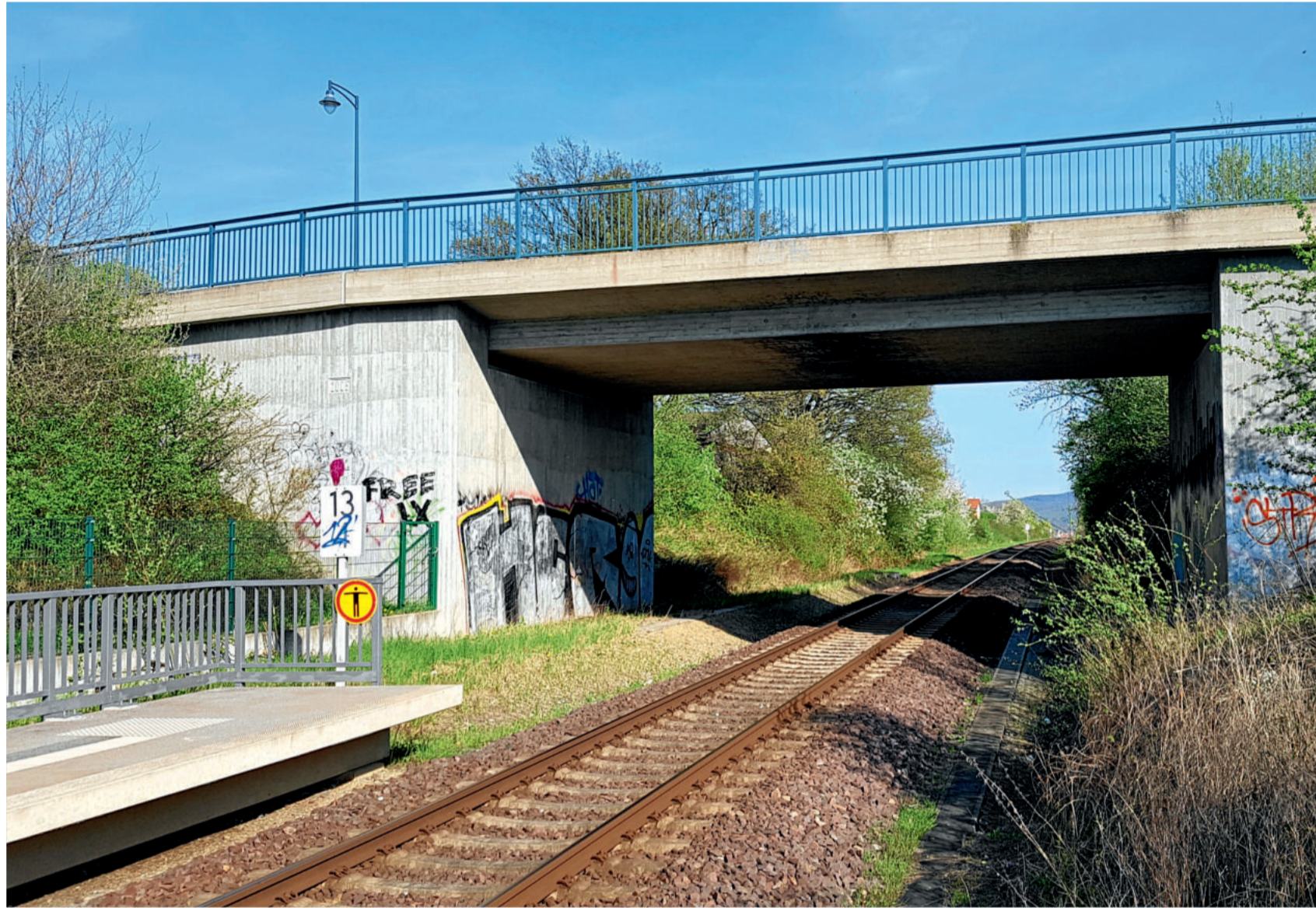
Neue und alte Brücke