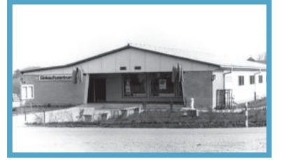
August: Früher Kaufhalle – heute Außenwohngruppe des Hauses Oehrenfeld