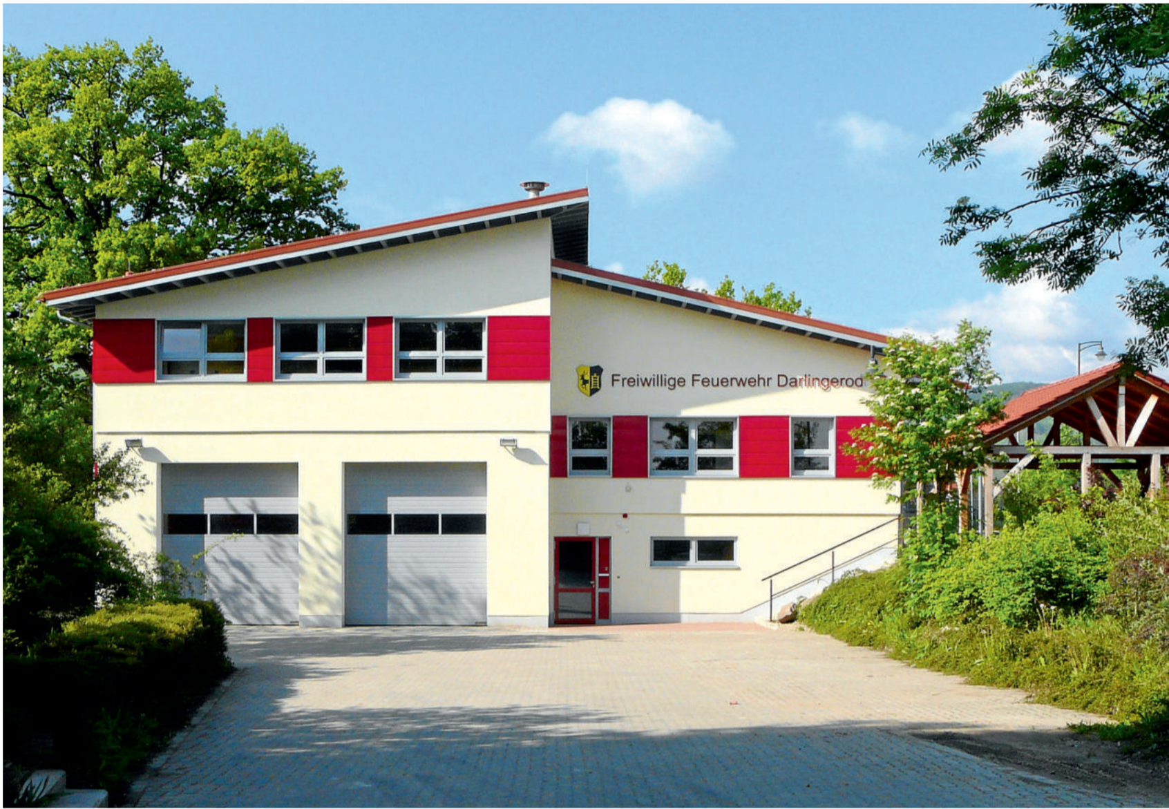
Gerätehaus und Feuerwehr