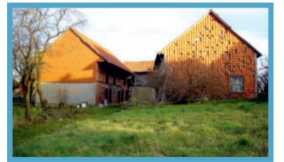
Dezember: Dorfstraße „Langer Hof“