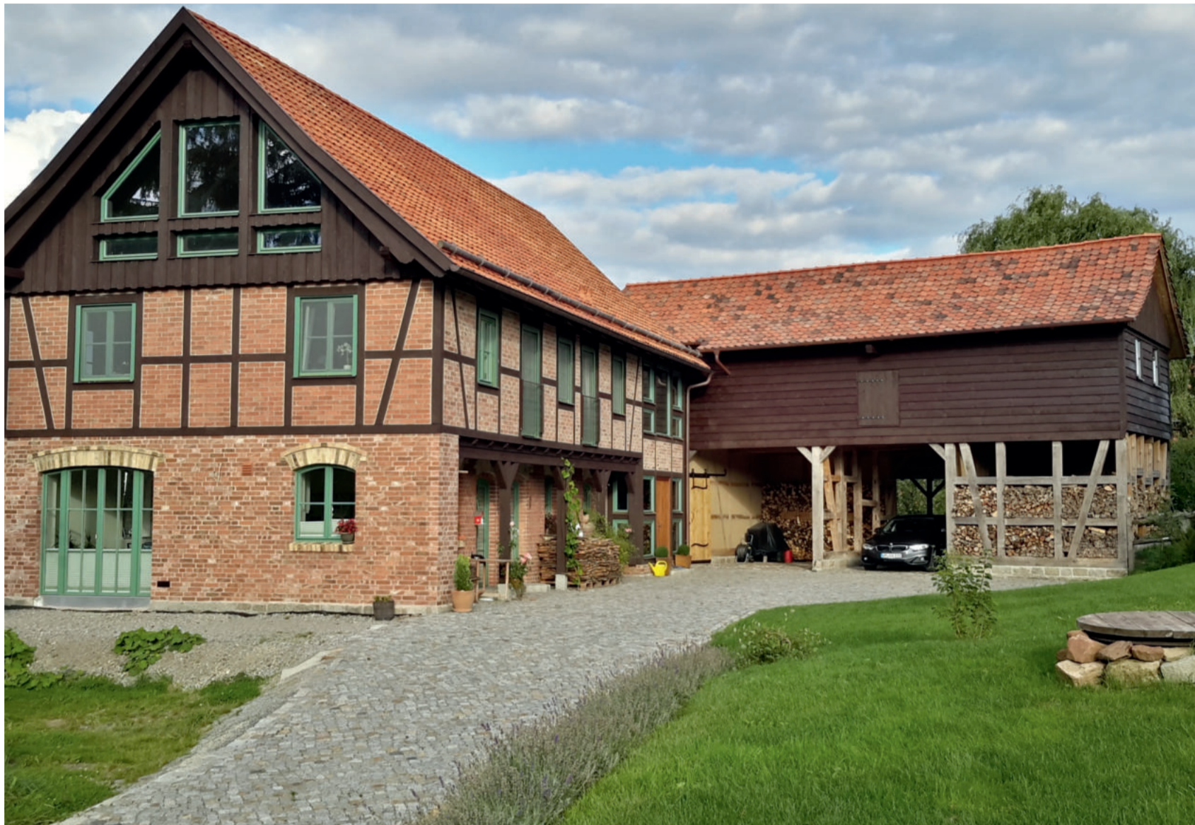
Dorfstraße „Langer Hof“