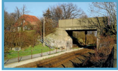
Januar: Neue und alte Bahnbrücke