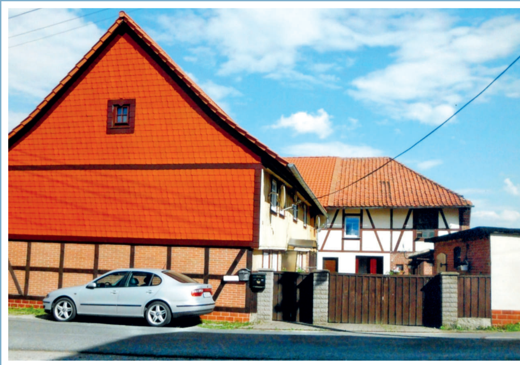
Hof „Pape“ – jetzt „Drude“