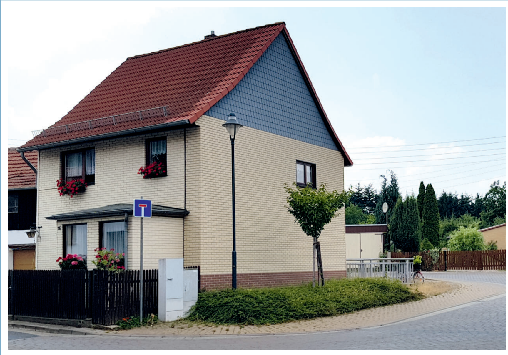
Kreuzungsbereich Oehrenfelder Weg Dorfstraße – Bahnhofstraße