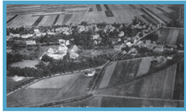
Titelblatt: Luftbild – Darlingerode aus Richtung Westen