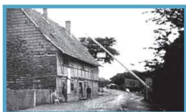
Juni: Chausseegeldhebeselle Darlingerode