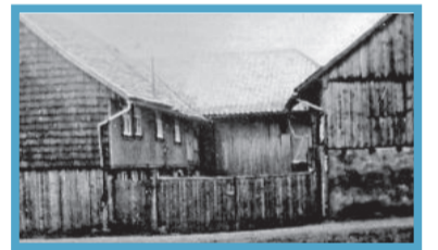
Oktober: Der Hof „Pape“ – jetzt „Drude“ Fotos: Bernd Peters Familie Drude