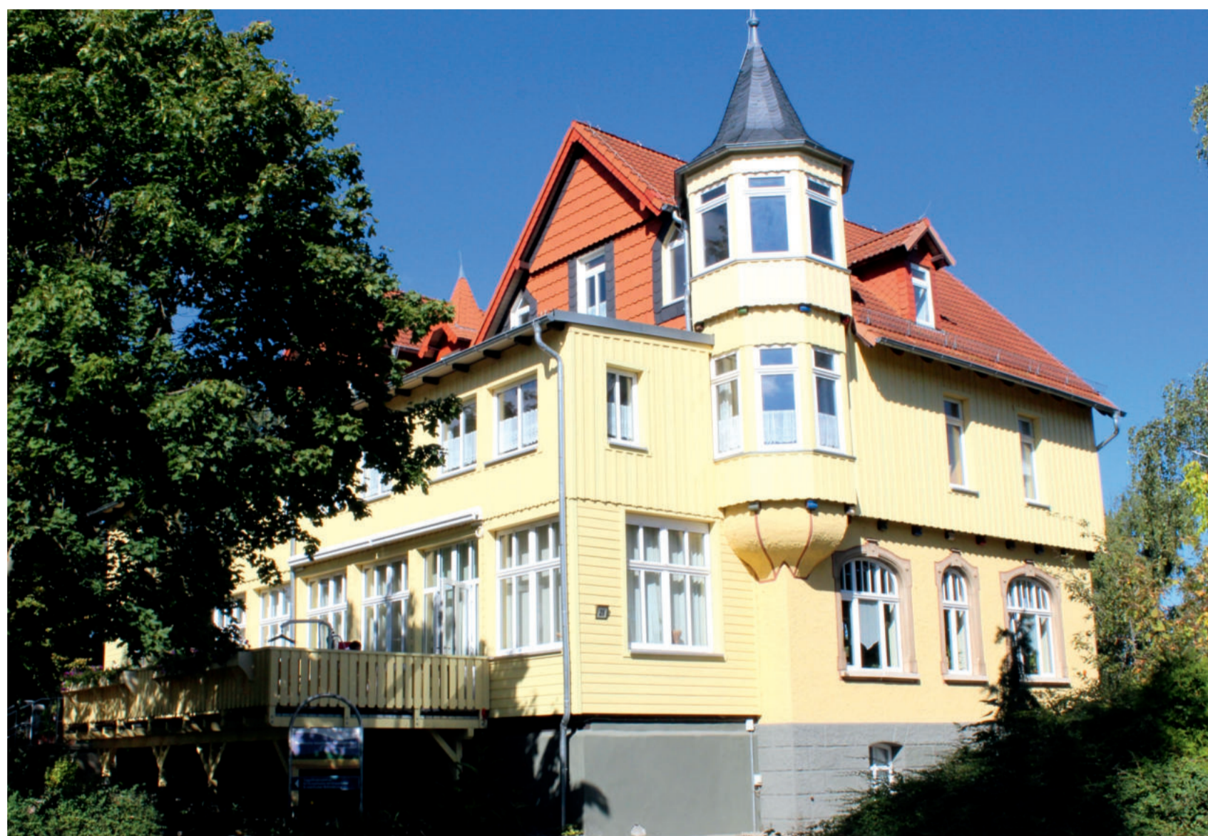
Hotel „Prinz Botho“ (oben) (unten) das „Kinderheim“ jetzt Tagesförderung „Haus Oehrenfeld“