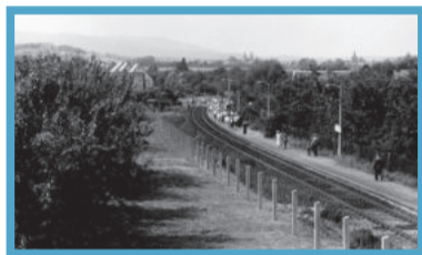
Februar: Bahnhof Darlingerode