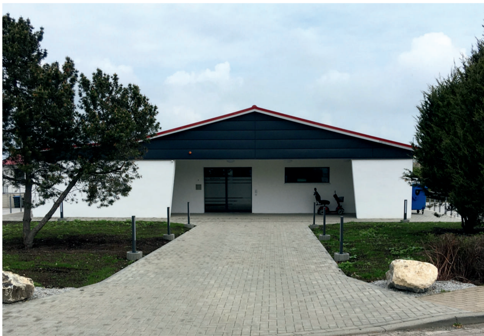
„Kaufhalle“ heute Außenwohngruppe des „Haus Oehrenfeld“