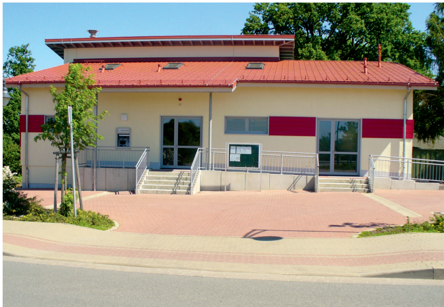
Gemeindeverwaltung jetzt auch Heimat der „Feuerwehrkinder“