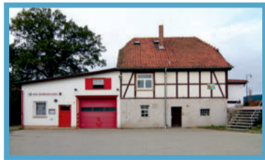
Mai: Gerätehaus der Feuerwehr Fotos: Wolfgang Böttcher Annett Reulecke