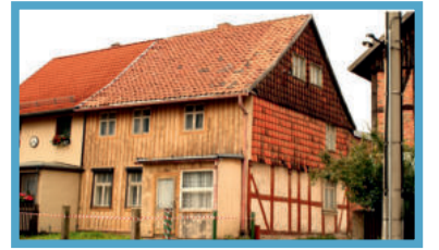
Juli: Kreuzungsbereich Oehrenfelder Weg Fotos: Wolfgang Böttcher Annett Reulecke