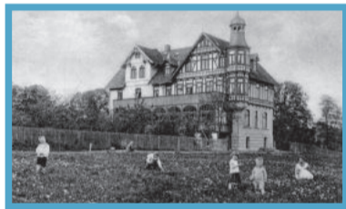
März: Hotel „Prinz Botho“ – Kinderheim (rechts)