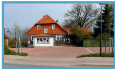
April: Gemeindeverwaltung und Heimat der Feuerwehrkinder Fotos: K.-H. Fischer Wolfgang Böttcher